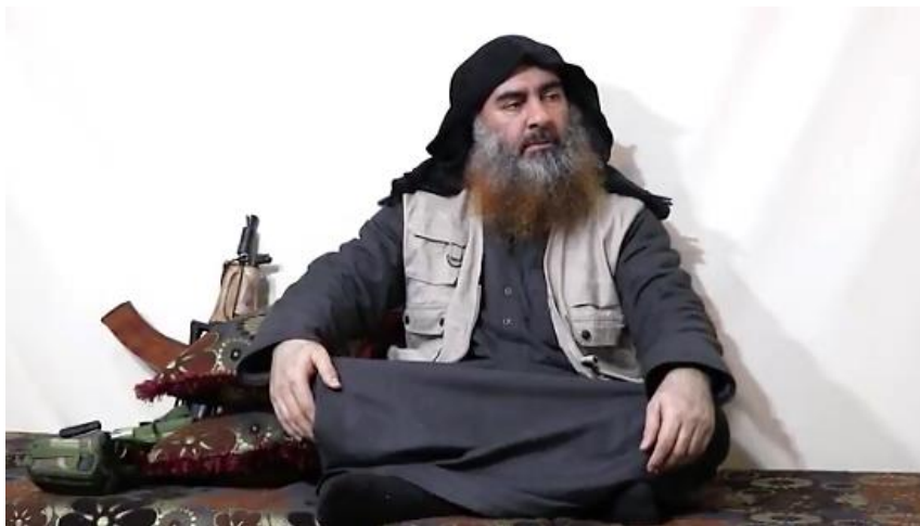
Абу Бакр аль-Багдаді з автоматом «Krinkov».

Претензіями на високий соціальний і мілітарний статус мотивовані фото численних польових командирів і ватажків збройних груп з цією зброєю. Наслідуючи легендарних муджахідів, аналогічні зображення мав і лідер ІД Абу Бакр аль-Багдаді.