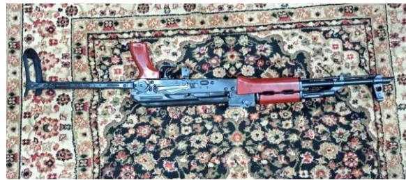
Моделі АКМ-С «Qalmsut», вироблені в Дарра Адам Хел, провінція Хайбер-Пахтунхва, Пакистан, 2020.

Іменем « Kirinkov » (або також « Krinkov ») позначається модель АК АКС-74У, відома у світі як «автомат бен Ладена».