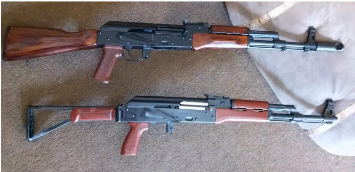
Моделі «Kalakov» і «Kalashnikov», вироблені в Дарра Адам Хел, провінція Хайбер-Пахтунхва, Пакистан, 2021.

Під іменем « Kalakov » фігурує модель АК під патрон 5,45×39 зі стандартним дерев'яним прикладом. Ця назва відрізняє цю модель від АК калібру 7.62, які переважно фігурують під іменем « Kalashnikov ». При цьому в північноафганських спільнотах, зокрема, серед узбецьких і таджицьких етнічних груп, а також в мілітарному середовищі Північної Америки цей автомат також має назву « три двійки » - відповідно до калібру: 0,222 дюйма або 5,6 мм. У свою чергу, модель калібру 7.62 також має назви « Krashnikov » і « Kalamai » в спільнотах центрального і південного Афганістану.