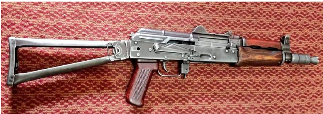
Модель «Kirinkov» (АКС-74У), вироблена в Дарра Адам Хел, провінція Хайбер-Пахтунхва, Пакистан, 2020.

Іменем « Kirinkov » (або також « Krinkov ») позначається модель АК АКС-74У, відома у світі як «автомат бен Ладена».