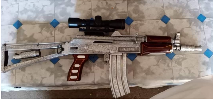
Модифікована і декорована, «статусна» модель «Krinkov», вироблена в Дарра Адам Хел, провінція Хайбер-Пахтунхва, Пакистан.

Претензіями на високий соціальний і мілітарний статус мотивовані фото численних польових командирів і ватажків збройних груп з цією зброєю. Наслідуючи легендарних муджахідів, аналогічні зображення мав і лідер ІД Абу Бакр аль-Багдаді.